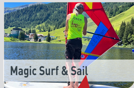
Magic Surf & Sail