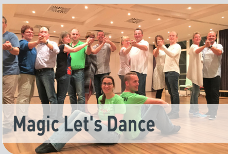
Magic Let's Dance